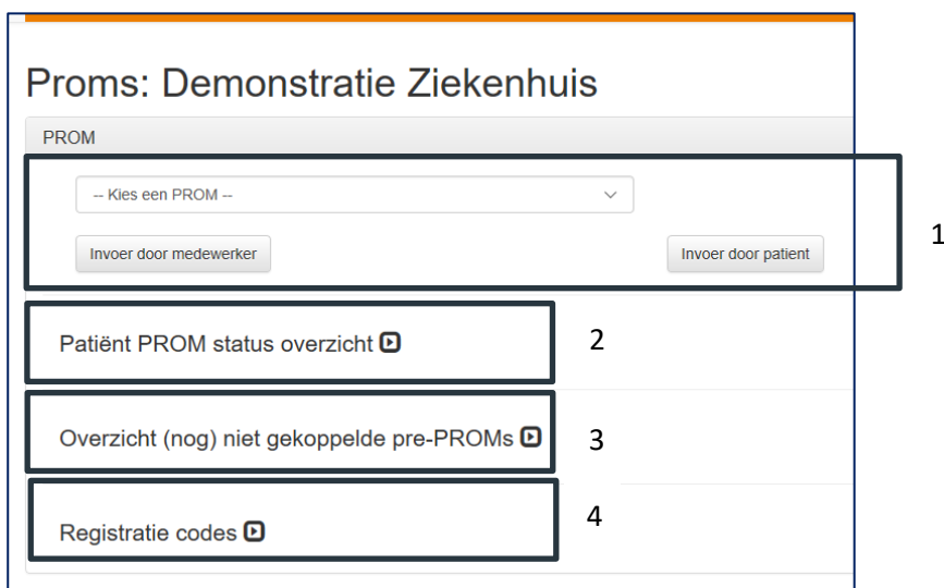
Afbeelding 6. PROMs meten

Verder kunt u in dit portaal PROMs meten, bijhouden welke patiënten voor een follow-up in aanmerking komen en opzoeken welke registratiecodes u gebruikt. Zie Afbeelding 6.