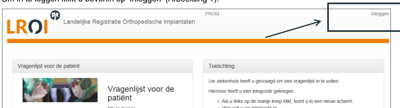
Afbeelding 2. Inlogscherms LROI-PROMs portaal

Om in te loggen klikt u bovenin op 'Inloggen' (Afbeelding 1).